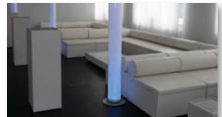
Lounge Mega-Seat in weiß mit diversen Loungemöbeln

Besonders komfortabel dank der integrierten Rückenlehne. Zusammen mit den Lounge Mega-Eck-Seats entstehen gemütliche Wohnlandschaften.