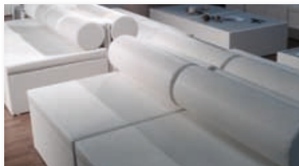
Lounge Mega-Seat in weiß mit Lounge Tischen im Hintergrund